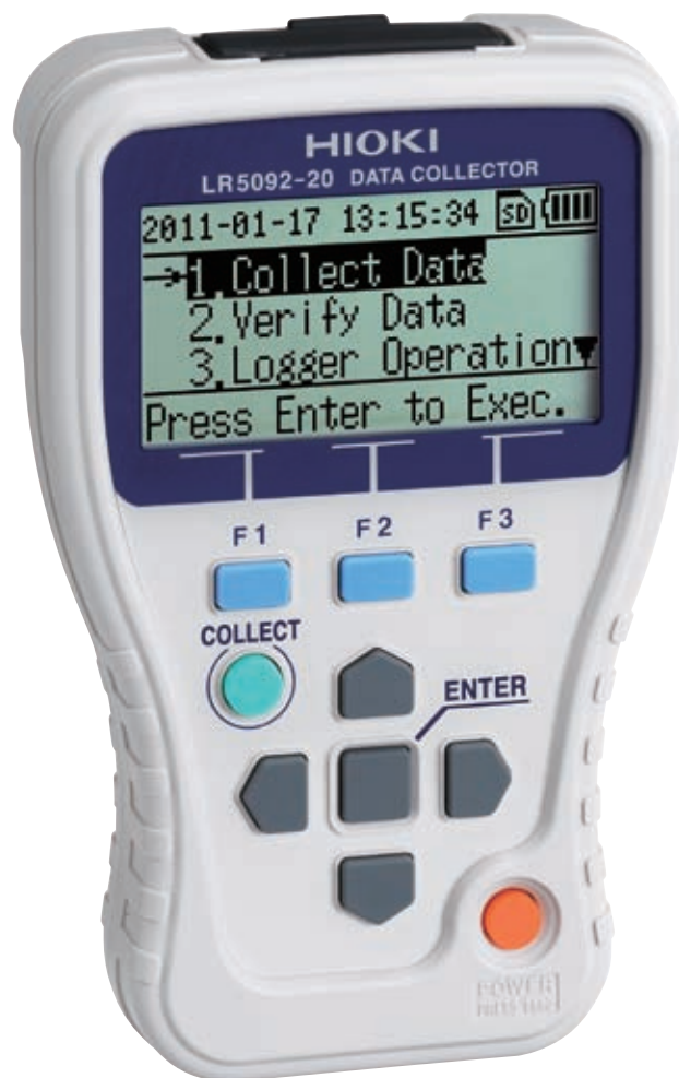
Rys. 2. Stacja zbierająca dane LR5092-20

Loggery napięcia są montowane w niewielkiej obudowie z tworzy-