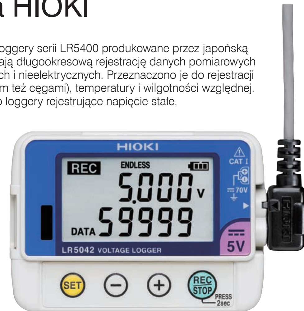
Rys. 1. Logger napięcia stałego LR5042

Do transmisji, przeglądania i obróbki danych zarejestrowanych przez loggery są niezbędne urządzenia pośredniczące współpracujące z komputerem.